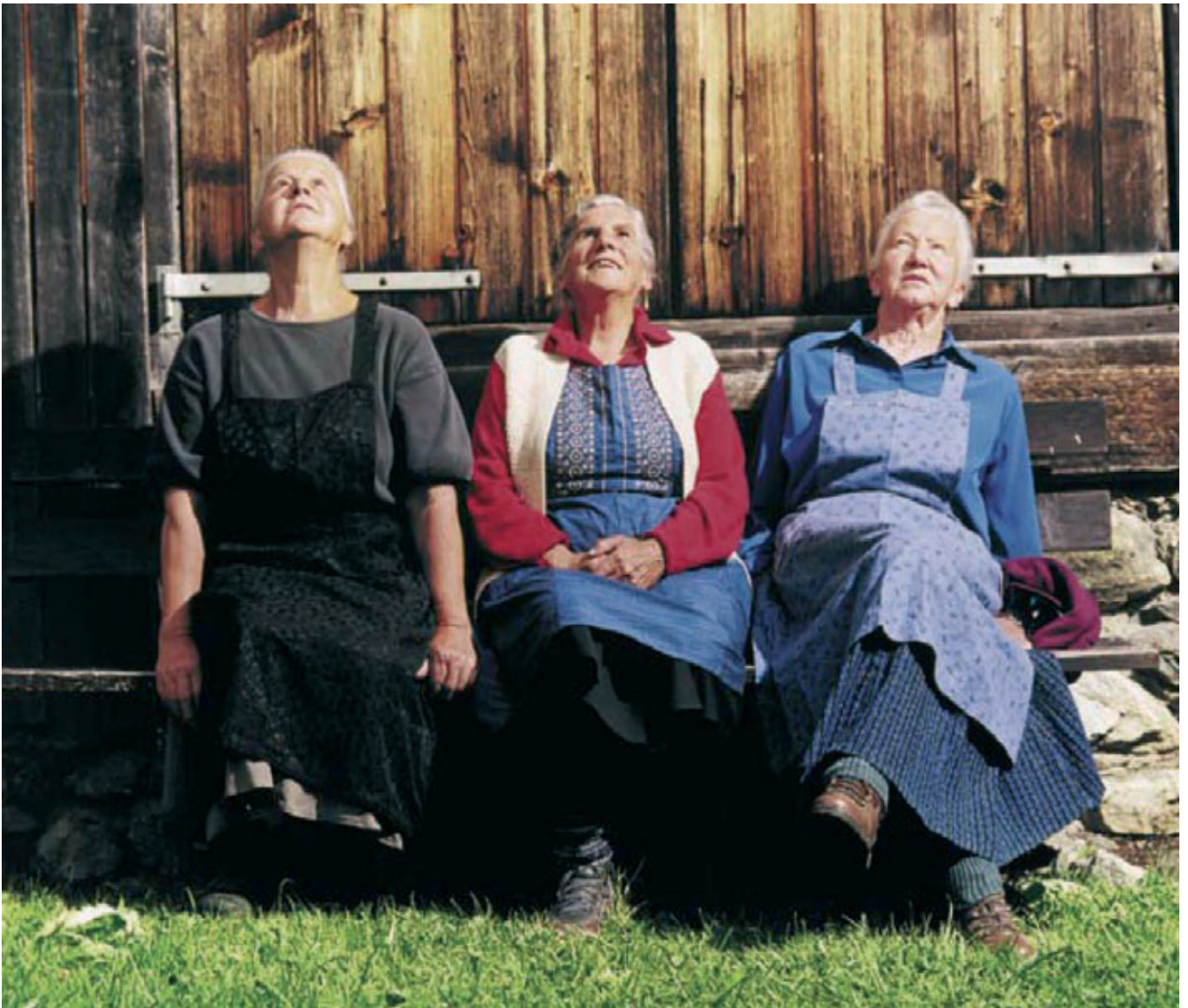
«In Graubünden ruft der Berg. Oder war es ein Mountainbiker?» Sujet aus der Kampagne «echte Ferien» von Graubünden Ferien.

Graubünden denkt ganzheitlich und langfristig. Graubünden sucht stets einen übergeordneten Standpunkt und eine sinnvolle, gültige Sicht der Dinge. Graubünden ist innovationsfreudig und offen für Neues – sofern dies im Einklang mit seinen Maximen und langfristigen Zielen steht.