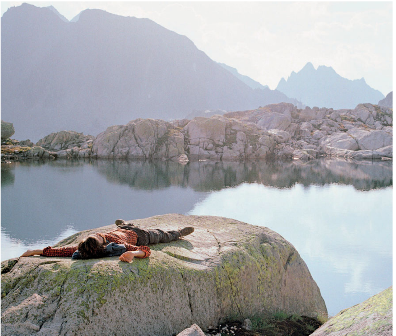
«Typisch Bündner: viel überschüssige Energie.» Sujet von Rätia Energie aus der Lancierungskampagne der Dachmarke.

Wir als gesamte Region reagieren vorausschauend, stellen uns den sich verändernden Umständen und Anforderungen und bieten zu jedem Zeitpunkt ideale Voraussetzungen für eine gesunde Arbeitswelt, aktive Erholung und Regeneration.