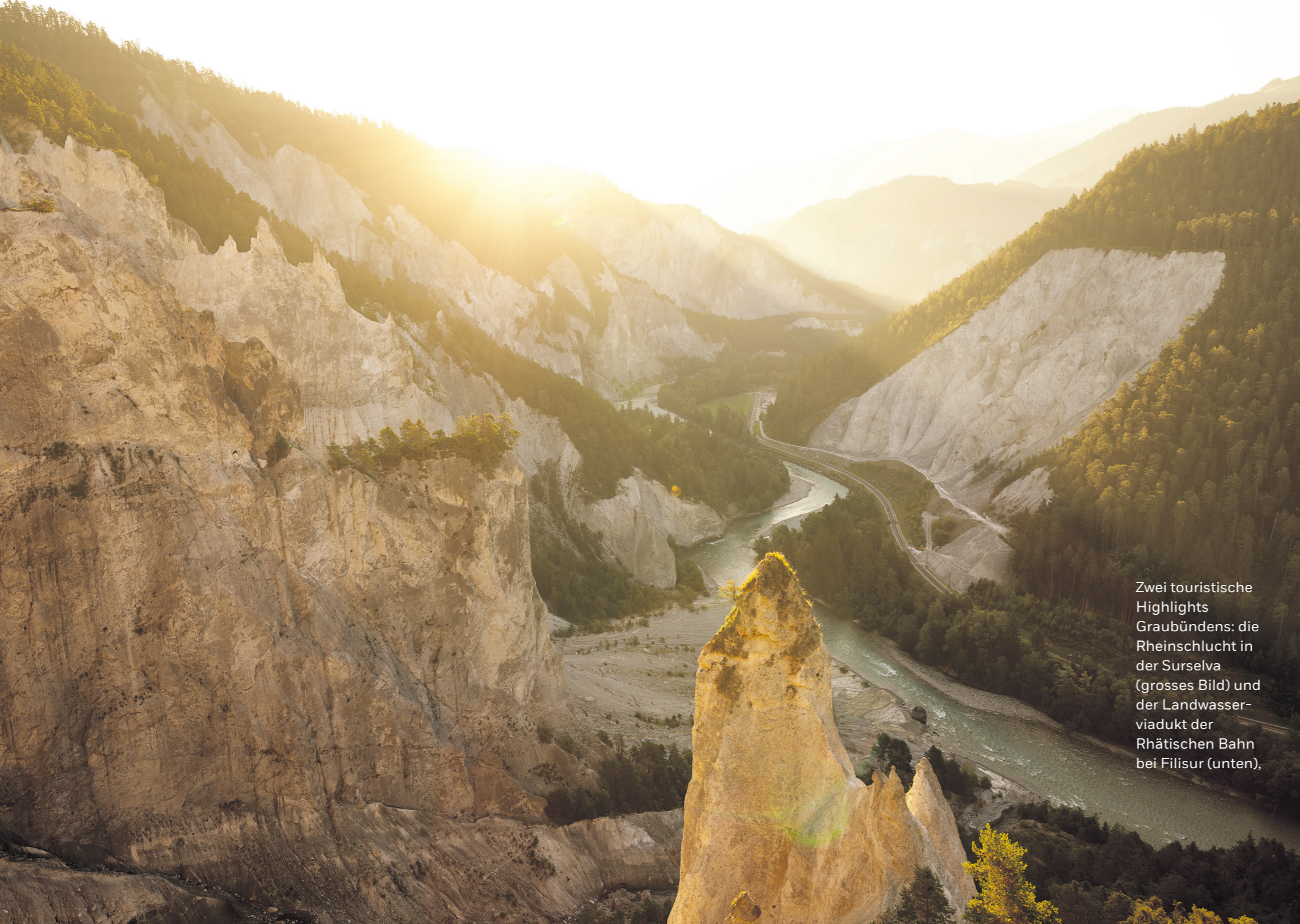
Zwei touristische Highlights Graubündens: die Rheinschlucht in der Surselva (grosses Bild) und der Landwasserviadukt der Rhätischen Bahn bei Filisur (unten).