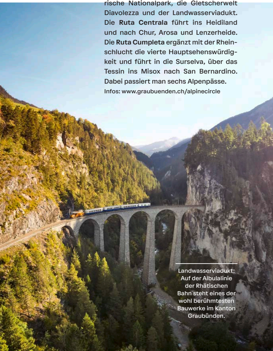
Landwasserviadukt: Auf der Albulalinie der Rhätischen Bahn steht eines der wohl berühmtesten Bauwerke im Kanton Graubünden.

erlebbar. Auf der Ruta Focus entdeckt man das Engadin mit drei von vier Sehenswürdigkeiten, dazu gehört der Schweizerische Nationalpark, die Gletscherwelt Diavolezza und der Landwasserviadukt. Die Ruta Centrala führt ins Heidiland und nach Chur, Arosa und Lenzerheide. Die Ruta Completa ergänzt mit der Rheinschlucht die vierte Hauptsehenswürdigkeit und führt in die Surselva, über das Tessin ins Misox nach San Bernardino. Dabei passiert man sechs Alpenpässe. Infos: www.graubuenden.ch/alpinecircle